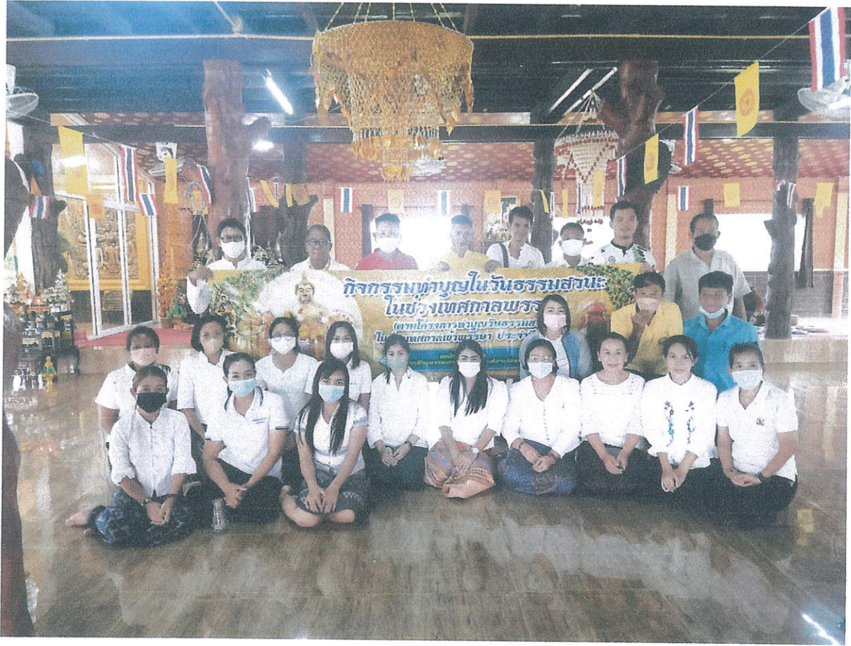
โครงการทำบุญวันธรรมสวนะในช่วงเทศกาลเข้าพรรษา ประจำปี ๒๕๖๕